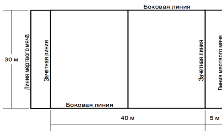
Рисунок 1 - Разметка площадки для игры тэг – регби

Линия зачетного поля - линия, за которую нужно приземлить мяч или забежать с мячом (если это предусмотрено правилами)