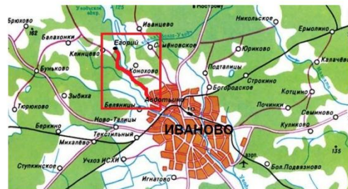
Район проведения похода